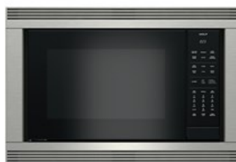
E SERIES STAINLESS