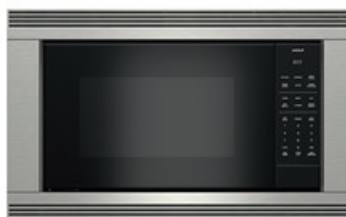
E SERIES STAINLESS